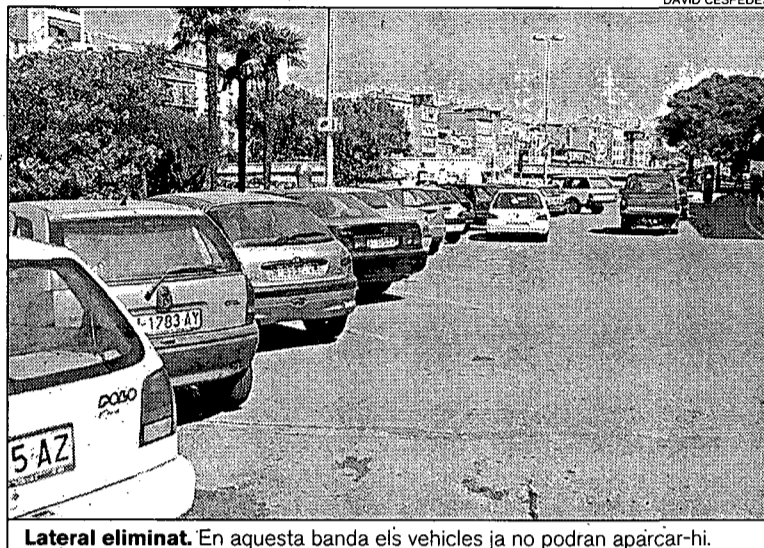
Lateral eliminat. En aquesta banda els vehicles ja no podran aparcar-hi.