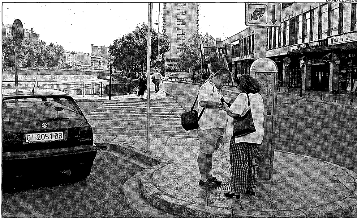
Més car. Les noves tarifes per aparcar en zona blava van entrar en vigor ahir al matí.

Menta proporcionarà diversos serveis a les llars i institucions de Salt com ara el programa Mentapacks que permetrà als usuaris contractar els serveis com ara telefonia, Internet i televisió de forma combinada i en aquest cas pagar la quota d'instal·lació d'un únic servei. DdeG