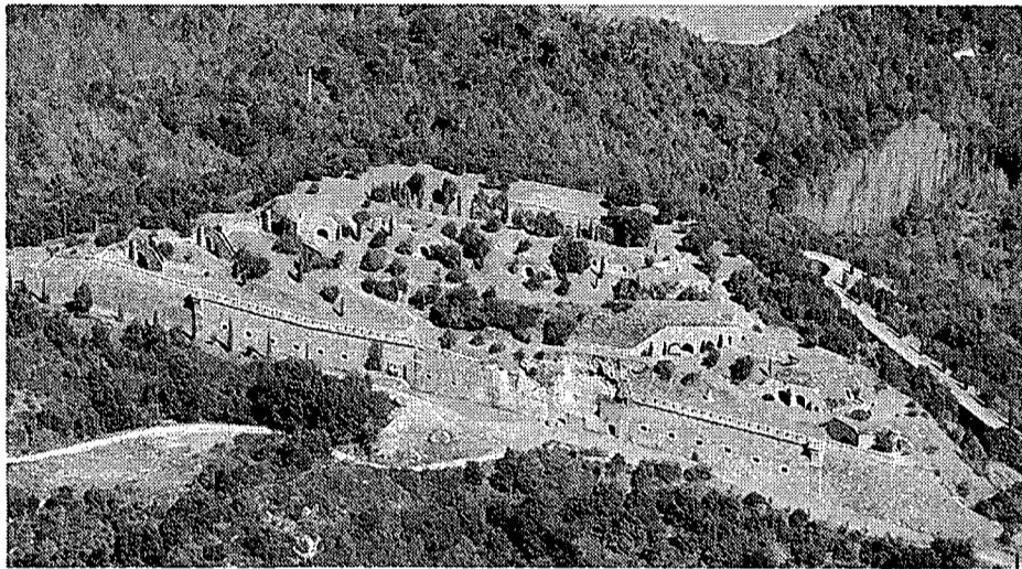
Una vista aèria del castell de Sant Julià de Ramis, que es podria convertir en un hotel si tira endavant el projecte previst.

La fortalesa de Sant Julià, catalogada com a bé d'interès cultural, es va projectar a finals del segle XIX per a la defensa de l'entrada nord de Girona. Al seu interior s'havien de situar diverses bateries d'artilleria però després de la I Guerra Mundial es van aturar les obres. Posteriorment va ser utilitzat com a polvorí fins que, al 1965, va perdre la funció militar i els baixos es van aprofitar per cultivar xampinyons. Al 1990 el Ministeri de Defensa va subhastar-lo i el va adquirir Lutecaf SA per 48 milions. Al 1991 va obtenir el vistiplau de l'Ajuntament i de Patrimoni per tirar endavant un gran complex residencial, hotel·ler, empresarial i cultural però Urbanisme, va suspendre