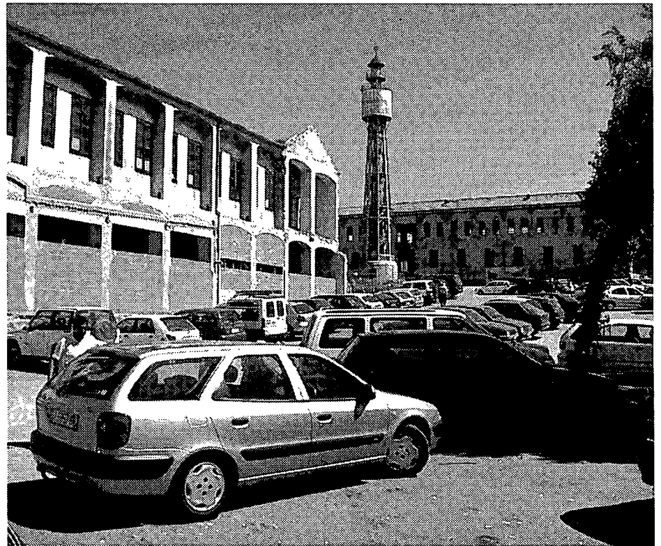
L'aparcament de Can Mario, un dels que explotava Mifas, a través de l'empresa Giropark, a Palafrugell. El va haver de deixar el passat 2 de gener.