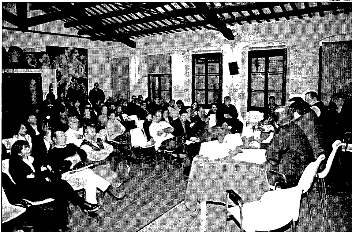
Debat obert. La polèmica concessió dels pàrquings de Palafrugell va fer aflorar diverses irregularitats.