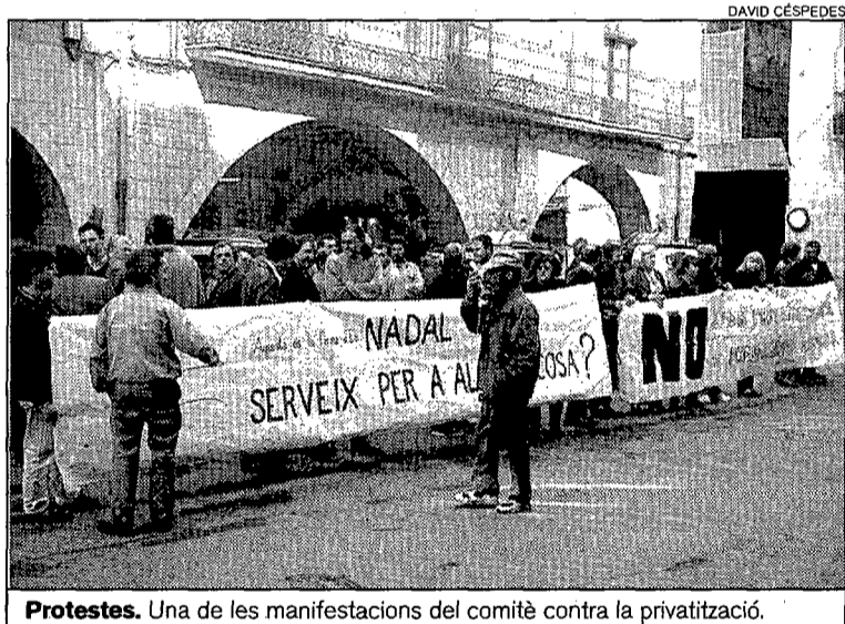
Protestes. Una de les manifestacions del comitè contra la privatització.

Aquesta circumstància xoca amb el fet que a «l'edifici consistorial hem comprovat que pels 520 metres quadrats, l'empresa Ccele s.a. contractava una persona 5 hores i ara ha contractat per netejar-los una nova persona però només amb 4 hores. A finals de febrer, que no hi va haver ni una treballadora, Ccele no va fer cap substitució». Precisament, aquesta empresa privada ha absorbit sis treballadores del servei de neteja que fins ara formaven part de la plantilla municipal. De les onze persones que integren el servei —dos a l'arxiu i nou a l'edifici de la plaça del Vi—, una ha passat a funcionària de la