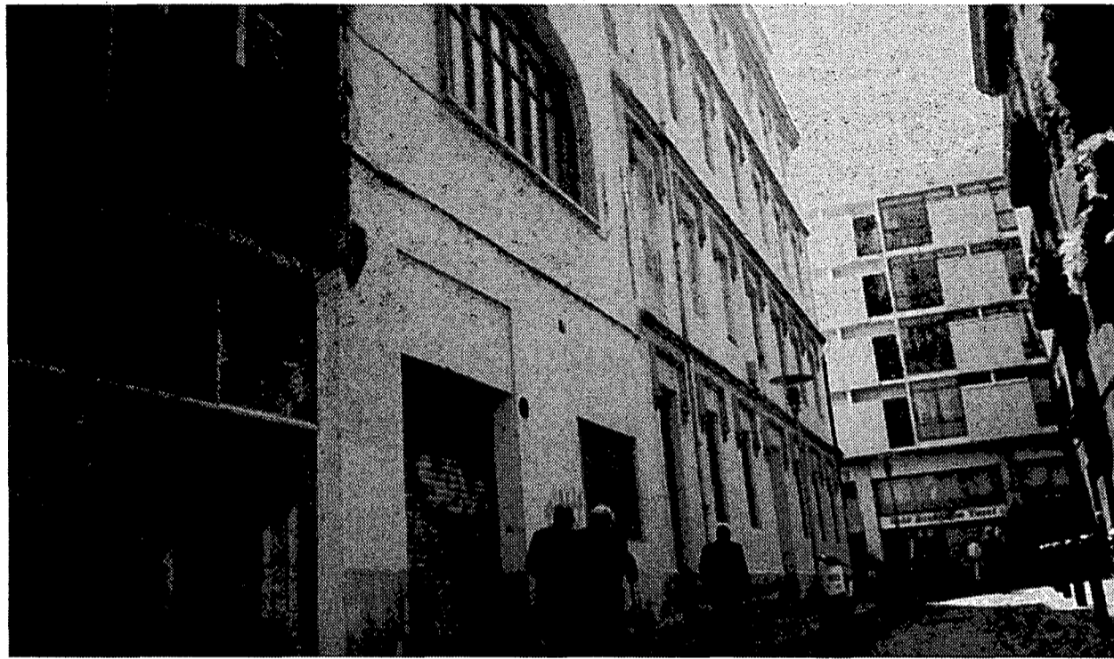
Al l'esquerra de la fotografia, la façana de l'antiga residència d'estudiants de les germanes Dominiques a Girona. Té façana al carrer del Nord i a l'Hortes, en ple barri del Mercadal.

La cadena Faderson és de recent creació i està vinculada a la família Granell. Actualment té dos hotels en funcionament a Barcelona, sota la marca City Hotels. Pel que fa a la gestió de l'equipament de Gi-