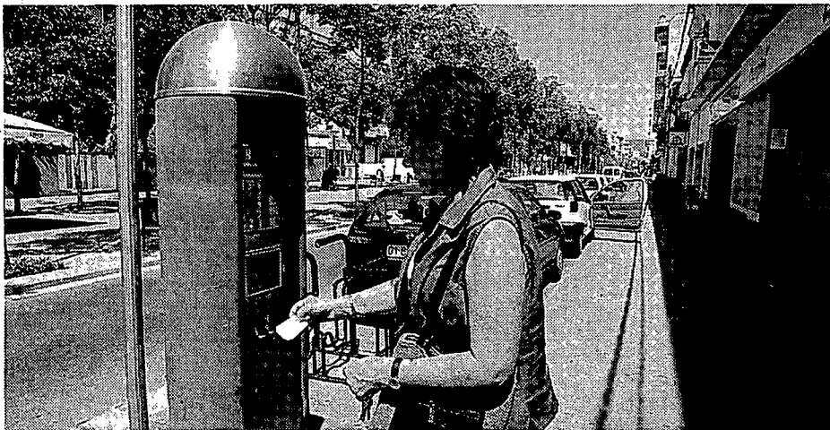
Una dona retirant el tiquet de zona blava, ahir al carrer Major de Salt, que des de l'agost passat només val 5 pessetes la primera mitja hora.

Els responsables de Giropark mantenen que l'Ajuntament els va canviar la tarifa «unilateralment, únicament com a compliment d'una promesa electoral» i si s'hi van avenir va ser en període de prova de tres mesos. Superat aquest temps i molt més, la concessionària manté que no pot suportar més les pèrdues que li suposa el fet que només es cobri un duro durant la primera mitja hora. Reclamen a l'Ajuntament que els compensi les pèrdues milionàries que tenen o que canviïn les tarifes. L'única proposta que han rebut de l'Ajuntament és que s'augmentin el nombre de parquings i que allarguin l'horari, però aquestes mesures no convencen l'empresa i amenacen de portar