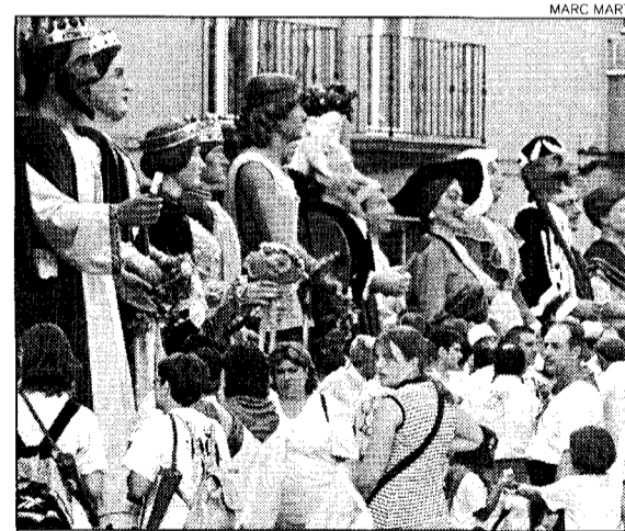
Gegants. La cercavila va reunir centenars de nens.