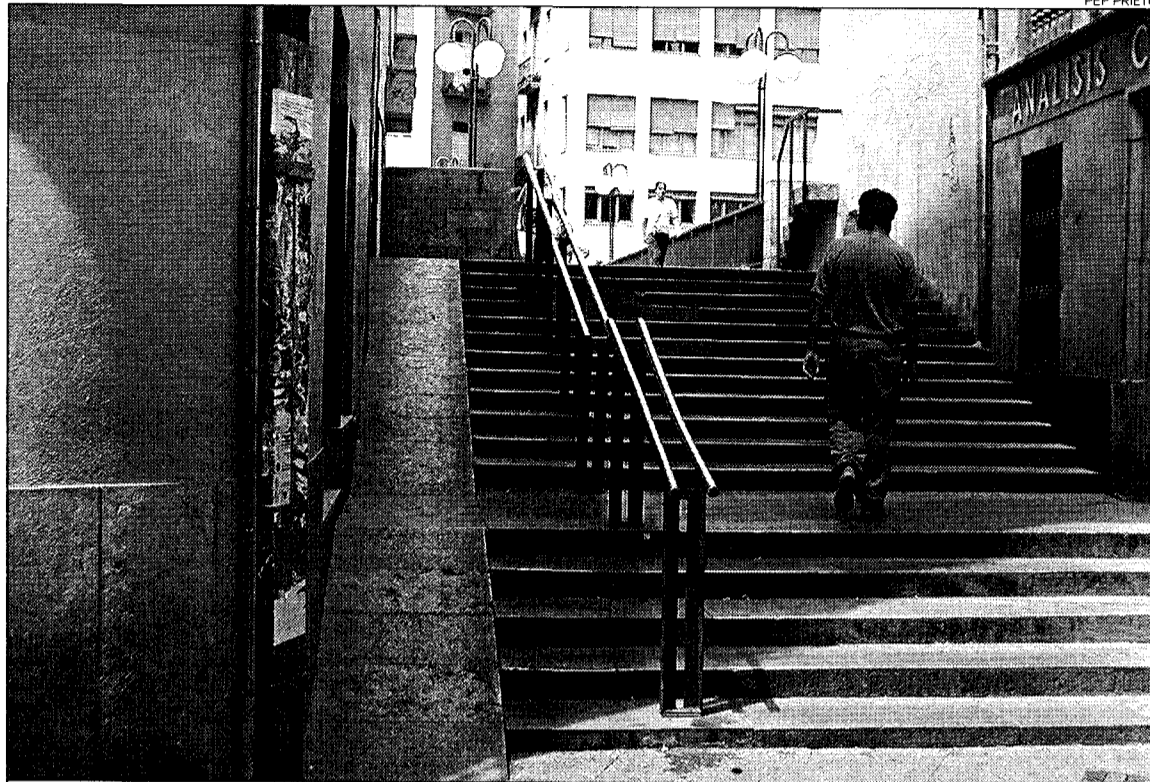
Barreres arquitectòniques. El pont de les Peixateries Velles és impossible de creuar pels discapacitats físics.

Les barreres arquitectòniques no són exclusives només del carrer, sinó també dels edificis. Per això, aquest any, l'Ajuntament treballa