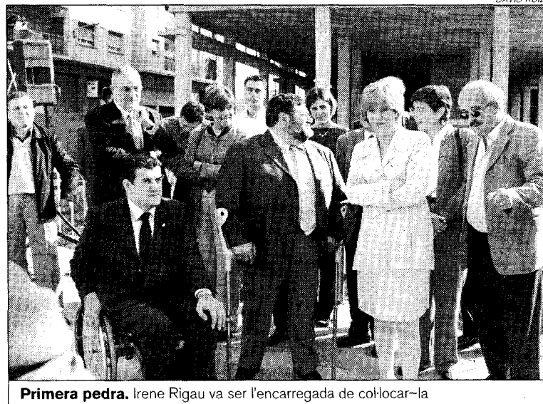
Primera pedra. Irene Rigau va ser l'encarregada de col·locar-la

El finançament de la nova llar per a discapacitats de Mifas es repartirà entre la mateixa associació de Minusvàlids Físics (cinquanta milions), la Generalitat de Cata-