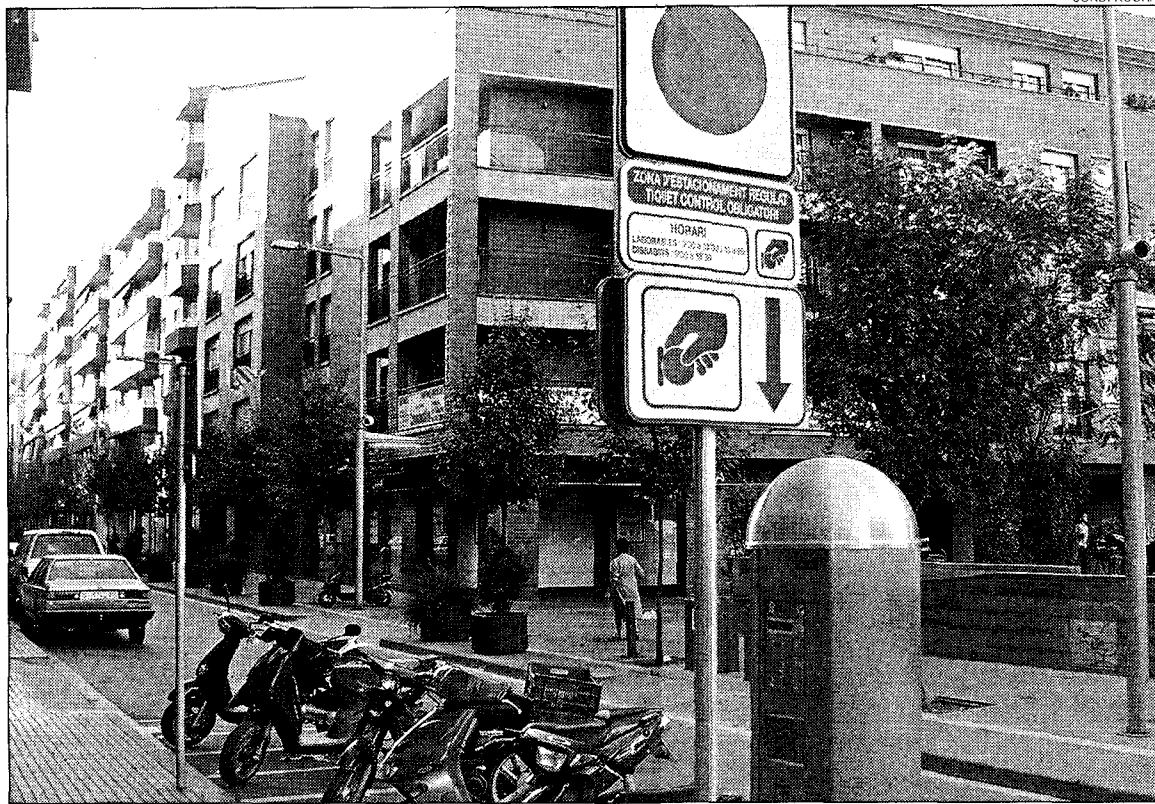
Zona blava. Les pèrdues provocades per la rebaixa en el preu de la mitja hora han obligat a rectificar l'Ajuntament.