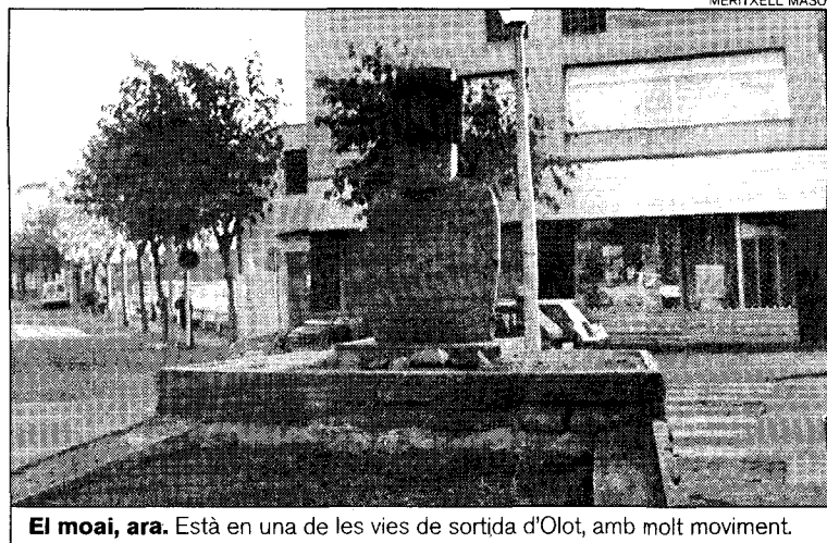
El moai, ara. Està en una de les vies de sortida d'Olot, amb molt moviment.

país a què pertany Rapa-Nui. No va arribar cap nota de conformitat, però tampoc cap queixa, diuen fonts municipals.