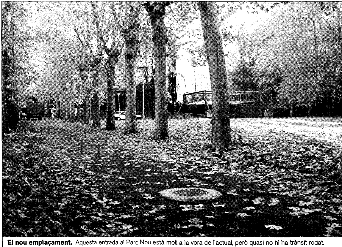
El nou emplaçament. Aquesta entrada al Parc Nou està molt a la vora de l'actual, però quasi no hi ha trànsit rodat.

Vilanova viatjarà cap a l'illa de Pasqua amb fotografies i plànols per explicar a les autoritats la nova ubicació que, personalment, creu que serà acceptada. La polèmica prové de la visita a Olot d'una delegació de l'illa, encapçalada per Pedro Edmunds, l'alcalde de la capital, Hanga-Roa. Aquesta delegació venia a un congrés sobre vulcanologia. Teòricament la ubicació del moai no havia de ser una sorpresa, ja que quan el consistori olotí va situar l'escultura a l'avinguda de Santa Coloma el 1984 el llavors alcalde, Pere Macias, va fer enviar a l'illa fotografies, plànols i una explicació. La plaça escollida està al final de l'avinguda Xile,