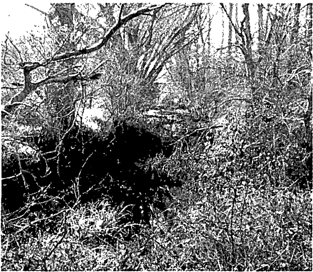
La Mugueta està molt emboscada i plena de fangs de la depuradora.