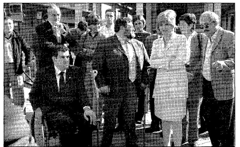
Primera pedra. Mifas va convidar diverses autoritats, l'octubre passat.

que «des del 1999 hem intercedit davant del Ministeri de Treball i Afers Socials i hem aconseguit que aquest any l'associació rebí 30 milions de pessetes pel centre». Aquests diners s'han d'afegir als 65 milions que Mifas ha rebut anteriorment i que contribuiran a finançar un projecte llargament reivindicat.