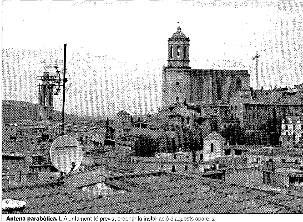
Antena parabòlica. L'Ajuntament té previst ordenar la instal·lació d'aquests aparells.

Ja fa temps es va recomanar als instal·ladors i clients que utilitzessin antenes col·lectives per evitar, precisament, que s'omplissin els balcons i les finestres amb equips individuals. Malgrat que la situació ha millorat, el cert és que en algunes zones de la ciutat resulta fàcil comprovar la massificació d'antenes. La regulació, en aquest sentit, podria ser especial-