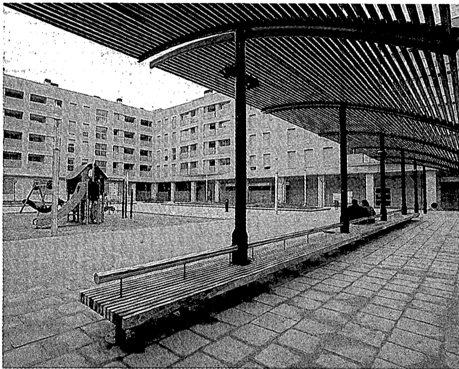
La plaça que s'ha construït a l'antic solar de Comexi al barri de Sant Narcís.

Els edificis s'han construït en forma d'U i hi ha habitatges i la residència de Mifas. El president de l'entitat, Pere Tubert, ha informat que l'obra de construcció està gairebé finalitzada i que s'espera que a finals de mes estigui tot a punt per començar a instal·lar-se. La inauguració es preveu per finals