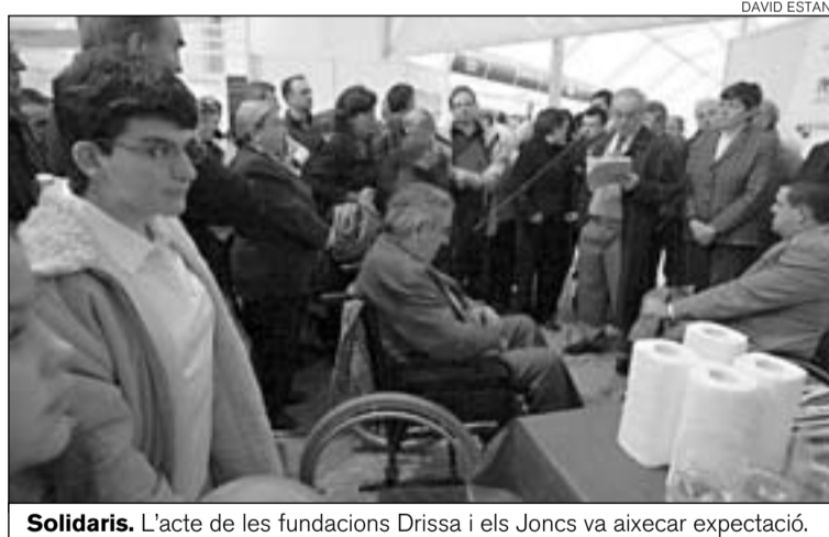
Solidaris. L'acte de les fundacions Drissa i els Joncs va aixecar expectació.

presentes AISL Projecte Onyar, l'Associació Montseny Guillerries, CO i CET Tramuntana, Centre Ocupacional i CET del Pla de l'Estany, Fundació autisme Mas Casadevall, fundació MAP, Fundació Ramon Noguera, ALTEM, ASTRES, Drissa, El Vilar, Els Joncs, Grup MIFAS, RAFT.3, Riudellots i TIGRI.