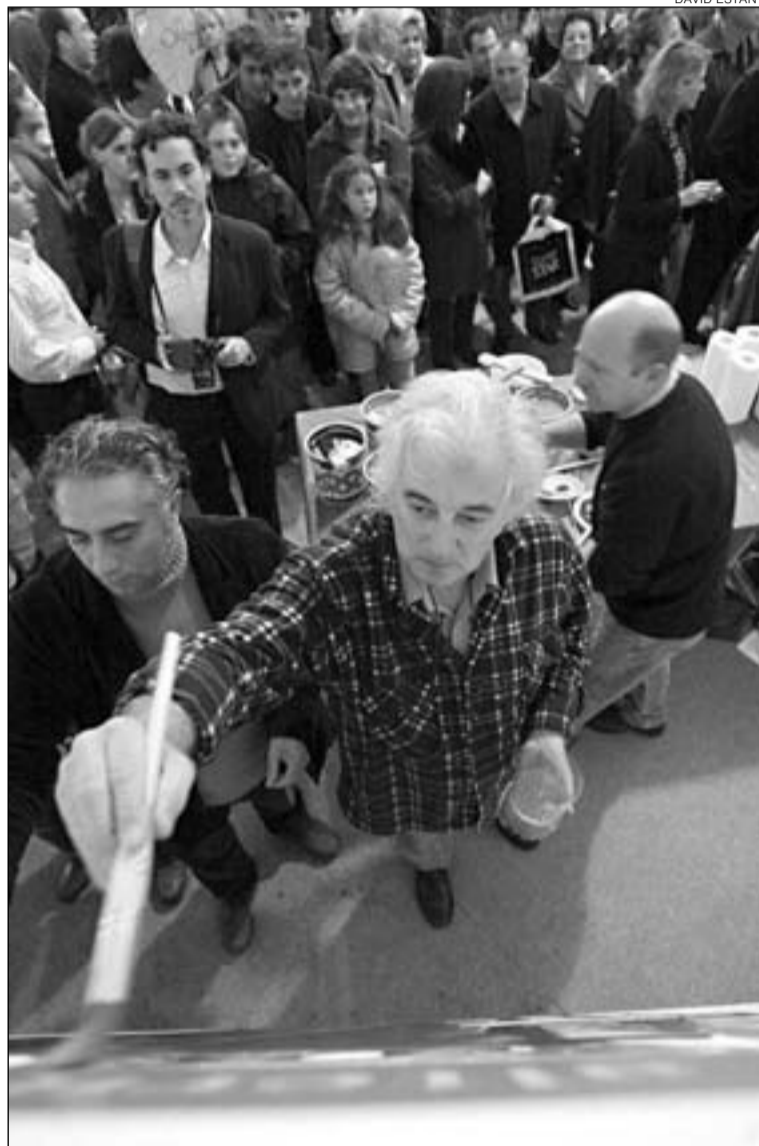
En acció. Els pintors gironins van crear un mural solidari a la Fira de Girona.