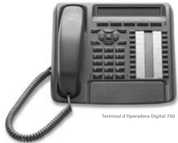
Terminal d'Operadora Digital 760

I no parlem de canviar la recepcionista.