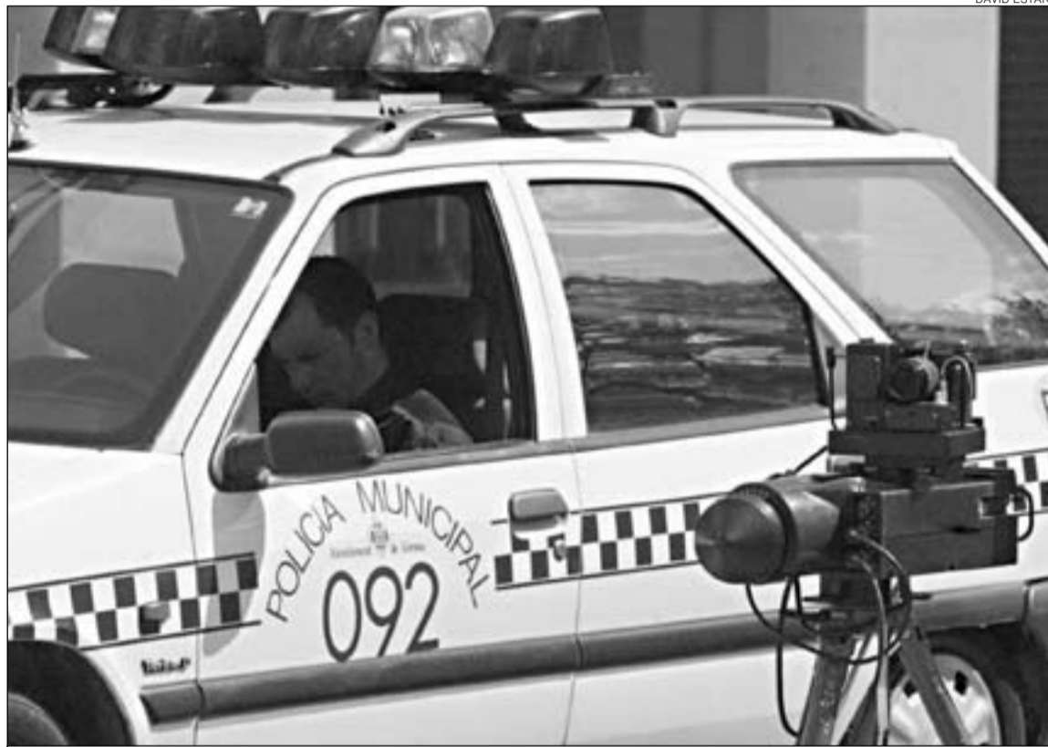
Velocitat. L'Ajuntament de Girona ha augmentat les sancions de trànsit per reduir l'ús del vehicle privat.