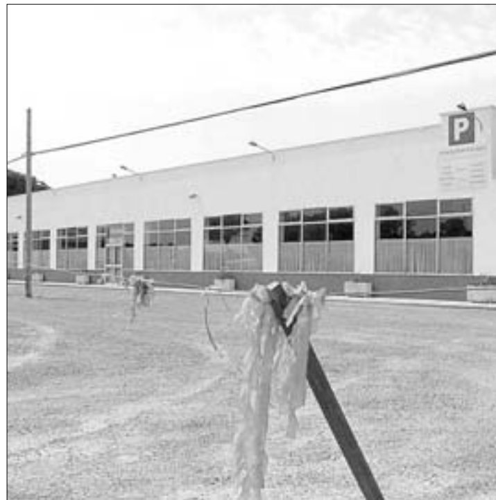
APARCAMENT. El pàrquing entrarà en servei la setmana que ve.

juntament de Riudellots. Per poder aconseguir una plaça dins del recinte s'haurà de fer amb antel·lació i mitjançant una pàgina d'Internet, una demanda de dia detallant les hores durant les quals l'interessat pensa ocupar la plaça. El pàrquing serà de pagament i vigilat les vint-i-quatre hores per personal de Mifas. Els conductors que viatgin en els diferents vols que s'enlairn des de Girona podran traslladar-se fins a la terminal des de l'aparcament, mitjançant uns autobusos llençadors, que seran gratuïts i que funcionaran ininterrompudament.