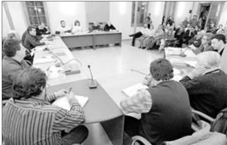
PLE DE CALONGE. El SAI no va presentar la moció de reprovació.