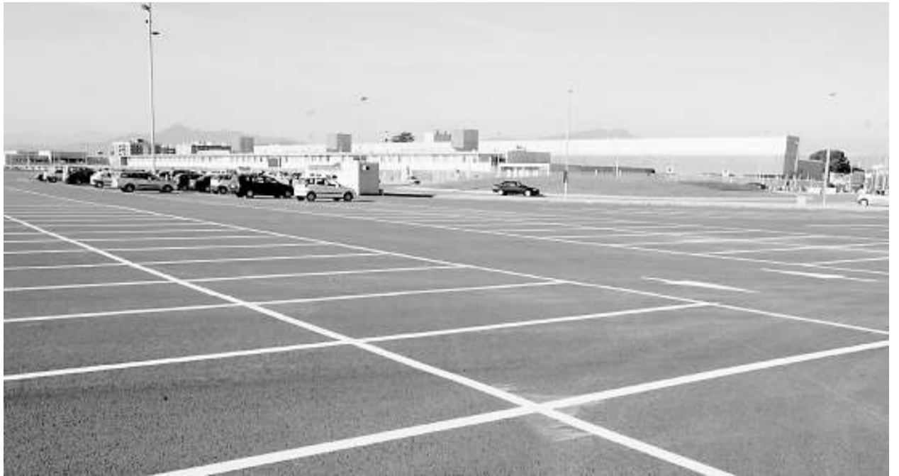
Pàrquing provisional habilitat per als usuaris del parc hospitalari Martí i Julià de Salt i que ara s'ofereix també als camioners.

El Ripollès Existeix recorda que la inversió prevista fins al 2010 solament preveu deixar la línia als estàndards de seguretat i de qualitat europeus. Així mateix, aposta per estudiar el traçat actual o, si cal un de nou, conjuntament amb el de la nova carretera N-152, que inclou el túnel de Toses. La plataforma, finalment, recorda que els pendents i els radis de gir de molts punts de la línia la converteixen en singular en el marc dels ferrocarrils europeus i, per això, reclama que la infraestructura ferroviària i el material mòbil s'hi adequin.