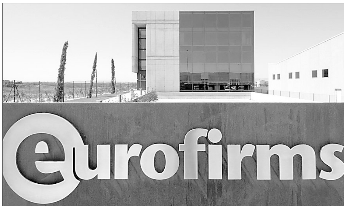
SEU CENTRAL. Noves oficines de la companyia a Cassà de la Selva

Amb poc més de 15 anys, els primers 10 amb només presència a les comarques gironines, Eurofirms ha obert 30 delegacions arreu del territori català. Durant el 2005 ha facturat prop de 40 milions d'euros