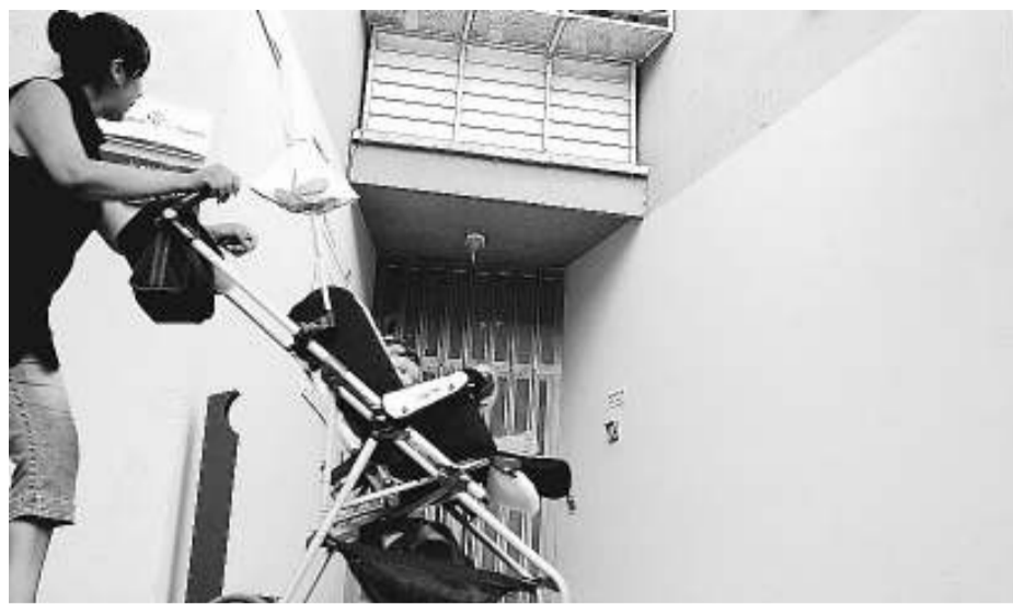
Una dona amb un nen al cotxet, just davant de l'entrada dels serveis socials.

trucció d'un ascensor extern a l'edifici per la falta d'espai a l'interior.