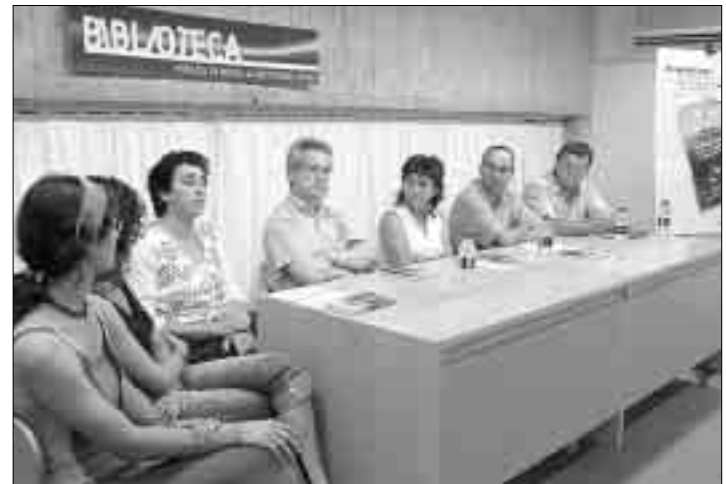
PRESENTACIÓ. Un dels moments de l'acte de presentació de la guia.

El llibre mostra el conjunt del patrimoni de l'espai