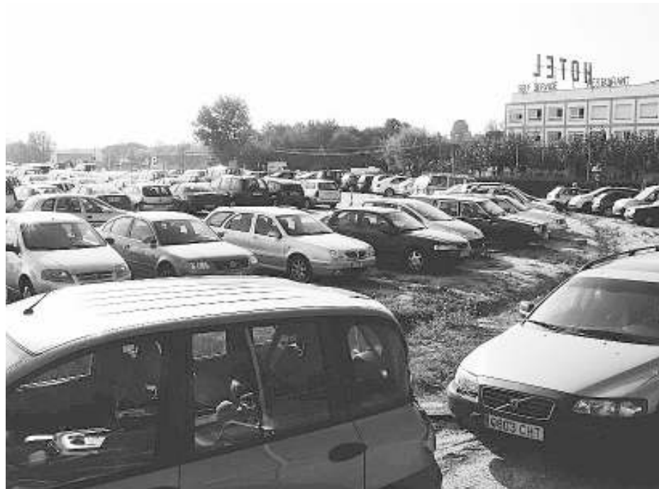
Una imatge d'arxiu de l'aparcament de l'aeroport que gestiona Mifas, ple de cotxes.

Fins ara, la zona era un aparcament que gestionava el col·lectiu de minusvàlids Mifas, i havia ajudat a pal·liar el dèficit de places de pàrquing.