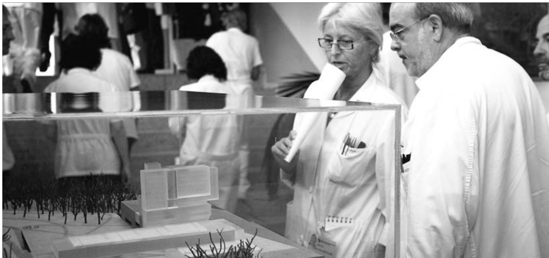
Personal sanitari observant ahir la maqueta del nou hospital de Girona després de la presentació del projecte bàsic per part de l'equip d'arquitectes Map & Idom