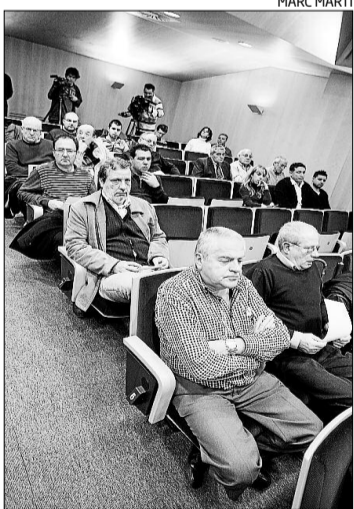
Assistents ahir a l'acte.

Vilaró va apuntar l'anterior consell d'administració com l'únic culpable dels actuals mals de l'entitat. «La seva gestió va ser nefasta, no es van fer les coses ben fetes. Fins i tot en els darrers mesos hem hagut de posar mà a la caixa per cobrir deutes amb els quals no