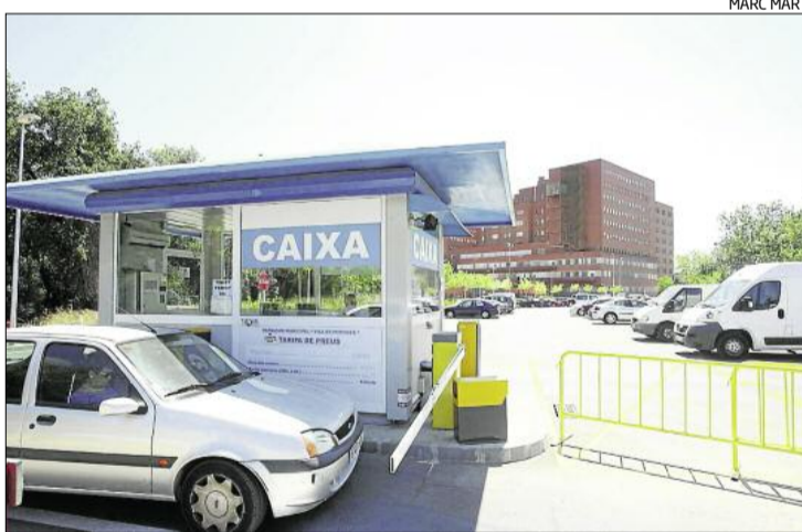
L'indret on instal·laran les consultes externes.

Per altra banda, Casanovas també va avançar que malgrat que s'han congelat algunes inversions, una de les prioritats del de-