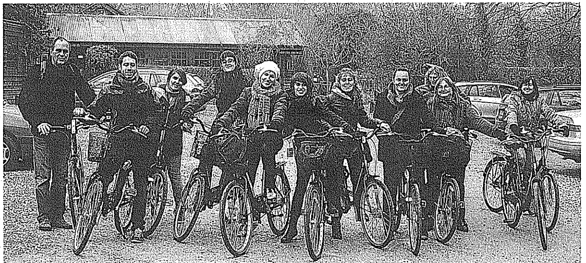
Van anar amb bicicleta als prestigiosos jardins de Grantchester, on van dinar i van provar menjar típic abans de fer el te a la casa d'un amic anglès

Sant Joan de les Abadeses, 28 de març de 2011.