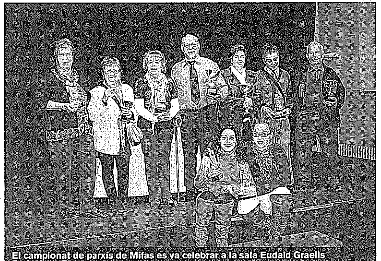
El campionat de parxís de Mifas es va celebrar a la sala Eudald Graells

RIPOLL | Redacció.- L'associació Mifas de Ripoll va organitzar dissabte a la tarda un campionat de parxís adreçat a persones amb algun tipus de discapacitat i que estiguin vinculades a aquesta entitat benèfica