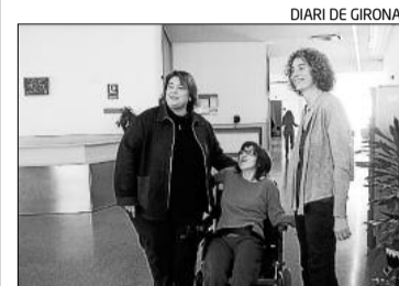
DIARI DE GIRONA