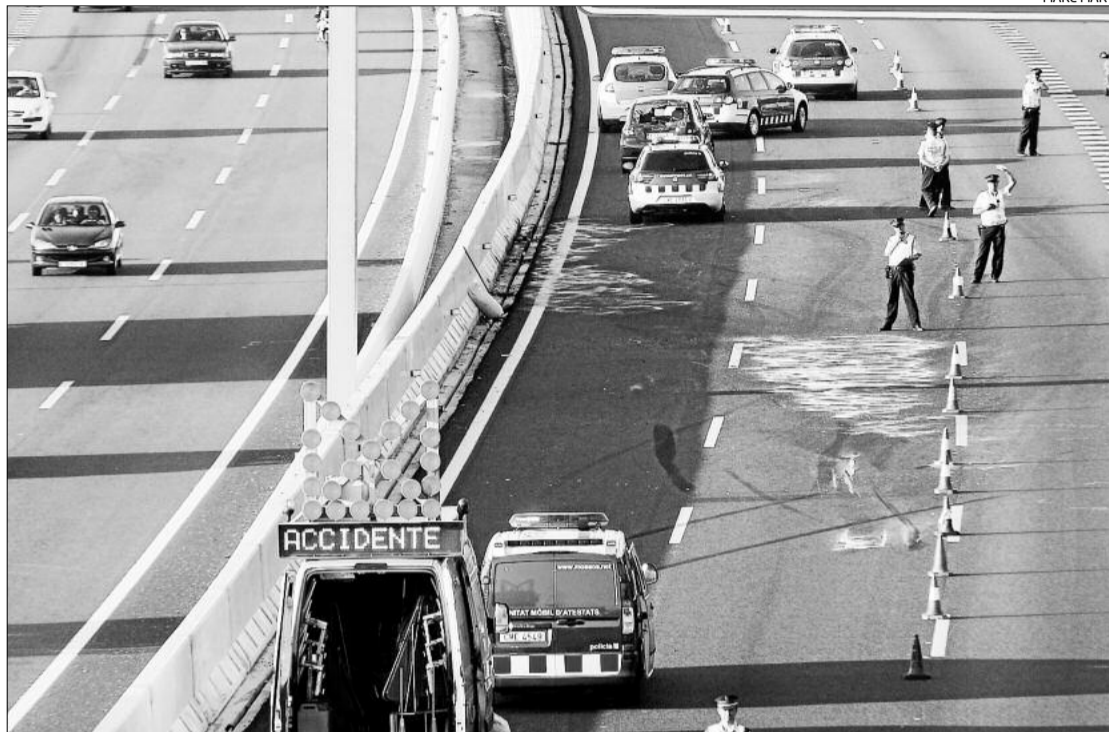
Un accident amb cinc vehicles implicats i dos ferits va provocar dos quilòmetres de cua a Maçanet.

En l'accident, que es va produir al voltant de dos quarts de sis de la tarda a l'alçada del quilòmetre 86 de l'autopista, s'hi van veure implicats un mínim de cinc vehicles, un dels quals era un tràiler que hauria bolcat. Aquesta circumstància va provocar que un dels ferits quedés atrapat al seu in-