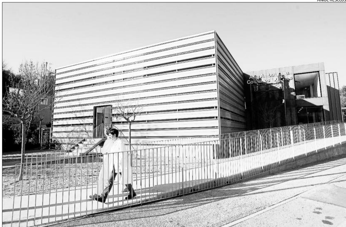
Els mòduls per a les urgències es van inaugurar el gener d'aquest any sobre un aparcament.

L'acord estableix que es tracta d'una indemnització per la concessió atorgada en el seu moment a Tadifi, per l'explotació d'una superfície de 2.300 metres quadrats que corresponen a 116 places d'a-