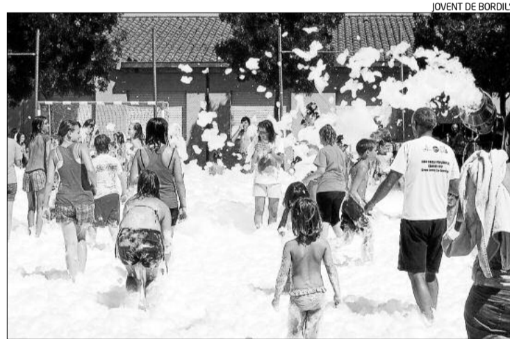
JOVENT DE BORDILS

Aquesta és la segona de les dues fires d'aquest caràcter que se celebren durant l'any a Banyoles, alternant la seva ubicació entre la plaça de les Rodes i el passeig Dalmau. Complementàriament, també està tenint un gran èxit una fira organitzada per la mateixa entitat i que està més enfocada als objectes infantils.