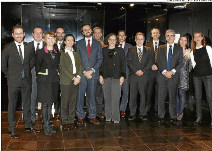
Assistents i representants de les marques finalistes i editores organitzadores del Premi Cotxe de l'Any dels Lectors.