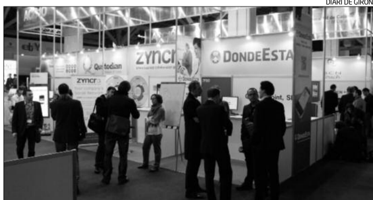
Estands d'empreses catalanes en en el MWC del 2012.

Giropark és una empresa del Grup MIFAS que presentarà al congrés les seves solucions per a optimitzar la mobilitat urbana, com ara PayPark, que en els darrers mesos ha obtingut reconeixements en certàmens com BCN apps jam, BDigital Glocal Con-