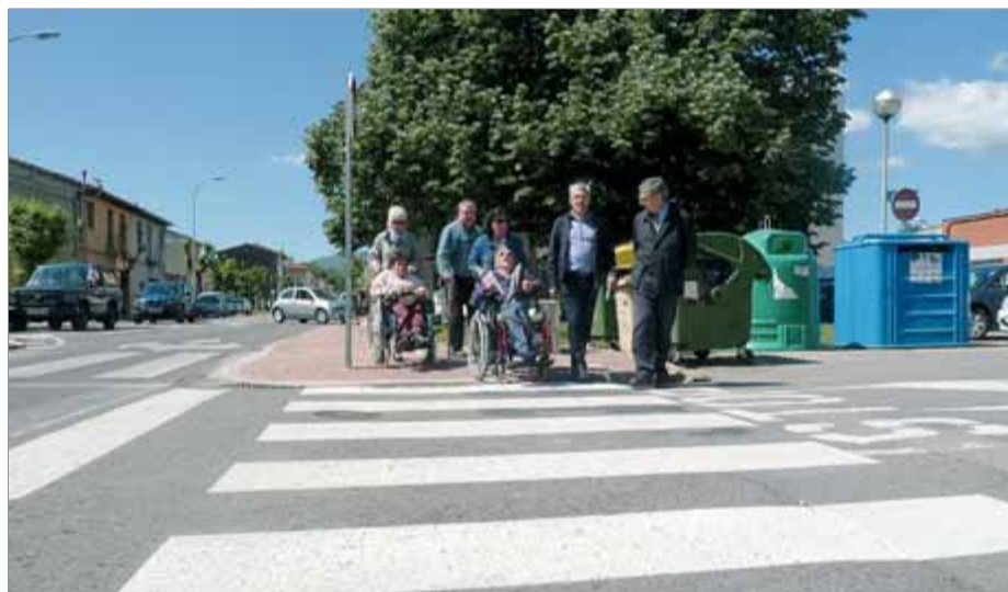
Un dels guals fets i membres de Mifas al pas de vianants al qual dona accés ■ J.C.

Tot plegat forma part d'un ambiciós programa d'eliminació de barreres arquitectòniques pactat amb Mifas i que ha suposat la inversió de 215.000 euros des del juny de 2011 i fins ara, i que arribarà als 300.000 euros a final d'aquest any. I té previst in-