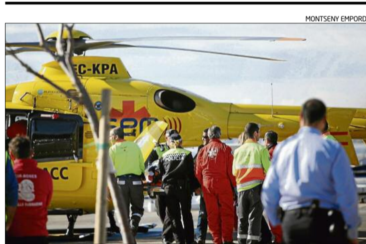
L'helicòpter medicalitzat va traslladar el ferit cap a la Vall d'Hebron.

Pel que fa als animals, se centraran sobretot a informar sobre l'obligació dels propietaris de gossos de recollir els excrements, de portar el gos correctament lligat o d'estar al corrent del cens municipal d'animals. L'objectiu és que tinguin especialment cura dels gossos potencialment perillosos que segueixen un protocol. Les quatre informadors s'ubicaran en parcs i jardins de la ciutat. Un altre camp en què actuaran serà en el control de la publicitat comercial a l'espai públic amb l'objectiu d'evitar males pràctiques en la distribució de propaganda. El regidor de Medi Ambient, Pere Giró, diu que la seva presència ajudarà a reduir les males pràctiques.