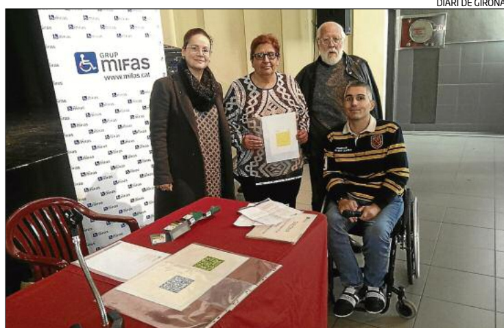
DIARI DE GIRONA

l'espera de tenir una confirmació concreta i oficial, les persones que utilitzen la N-II entre Caldes i Sils en són els més perjudicats.