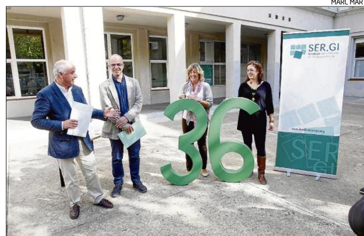
SER.GI i col·legis professionals, durant la presentació de la campanya.