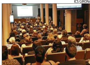
La sessió formativa d'ahir.

■ La Unitat de Neuroimmunologia i Esclerosi Múltiple (UNIEM) de l'hospital Trueta de Girona participa actualment en més de 20 estudis de recerca i assaigs clínics sobre les formes de la malaltia i en diversos projectes competitiu, pels quals ha rebut finançament públic i privat, dirigits a identificar biomarcadors moleculars de pronòstic de la malaltia i de resposta al tractament. També ha rebut ajudes per analitzar les imatges avançades de les lesions que es detecten i l'evolució de l'atròfia cerebral mitjançant ressonància magnètica. En els darrers cinc