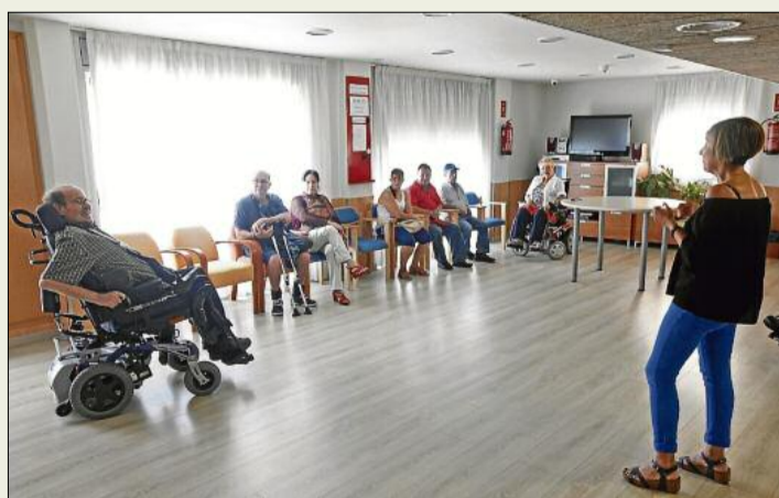
Jornada de portes obertes a la residència de Mifas, al juny. ANIOL RESCLOSA

La creació del Centre d'Atenció Integral Mifas i la posada en marxa d'unes aules per oferir formació reglada als seus associats, amb l'objectiu de millorar les possibilitats laborals, han estat les dues novetats més destacades del 2015, un any en el qual l'entitat ha mantingut tots els seus programes i ha apostat per oferir una atenció més personalitzada