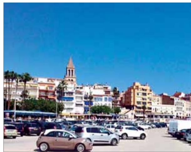
L'aparcament de la platja Gran, ahir a la tarda

seva gestió, Giropark subrogarà el personal contractat per l'antiga empresa concessionària, que farà el control dels aparcaments de la Platja, la Planassa, del carrer Moll del port, l'Equitativa i la Fosca, amb prop de 850 places. ■