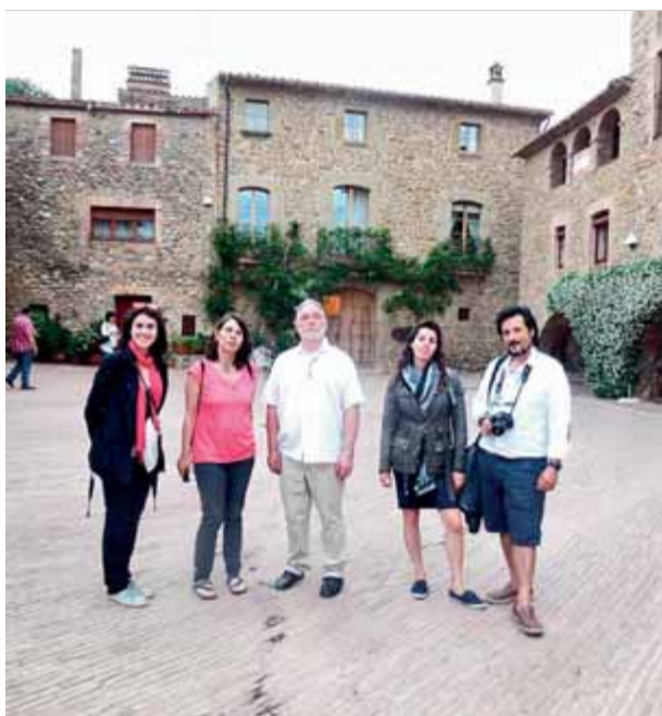
Els professionals cinematogràfics, aquesta setmana, a la popular plaça de Monells