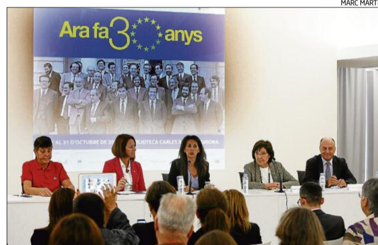
La taula rodona es va celebrar ahir a la biblioteca Carles Rahola.

L'objectiu de l'Ajuntament és continuar lluitant contra el consum d'alcohol al carrer i també reduir les molèsties als veïns. La mesura s'haurà d'aprovar en el ple de dilluns que ve.