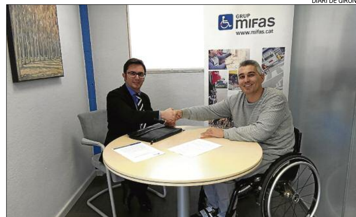
D'esquerra a dreta, el responsable d'Ibercaja i el president de Mifas.

L'objectiu d'aquest servei és promoure la recerca organitzada i sistemàtica d'un lloc de feina, tasca per a la qual es comptarà amb el suport d'un psicòleg i orientador laboral. La finalitat és preparar la persona per a la seva incorporació al mercat laboral.