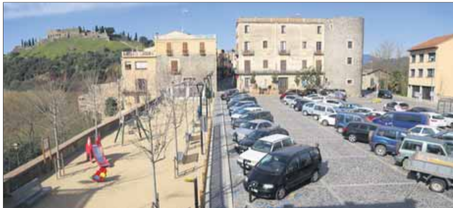
Una imatge recent de la plaça dels Bous d'Hostalric, al centre del poble. El pati expropiat (al fons) és d'una casa deshabitada del carrer Major, a l'altra banda d'un bar

La superfície que s'expropiarà és de 61 m 2 i correspon al pati de la casa del carrer Major, número 2. Segons informa l'Ajuntament, l'espai, d'ús privat, és considerat sistema d'espais lliures, "places i jardins urbans", en el pla general. Pel batlle, Josep Antoni Frias (CiU), "aquest és