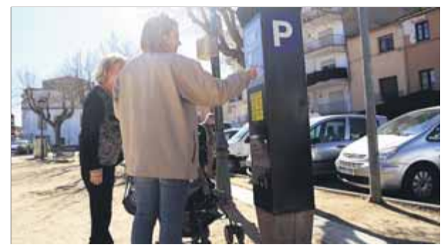
L'empresa GiroPark, del grup Mifas, durà la zona blava sis anys més. A la foto, un parquímetre a la plaça del Firal ■ Q.P.

nel Mosquera. Segons una primera estimació, el que té un preu més elevat són les soleres i paviments (més de 150.000 euros). Paral·lelament, es farà un aparcament públic a Can Llena i s'actuarà al fossat del castell. ■