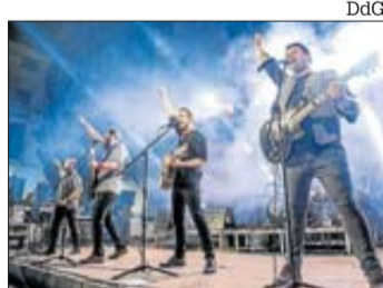
El grup Ebrí Knight.

► A 2/4 de 10 de la nit Cercabirres (Sant Cebi-