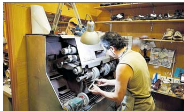
Un treballador que es va beneficiar del programa el 2019. DdG

desenvolupar el programa amb dotze entitats socials de Girona que hi col·laboren. Es tracta d'ALTEM, Aspronis, Clúster Èxit, Càritas Diocesana de Girona, Fundació Acol·lida I Esperança, Gentis Girona, Intermedia Girona, La Fageda, la Fundació Map, l'associació Mifas i Oscobe; a més de Creu Roja, amb qui l'acord és d'àmbit estatal.