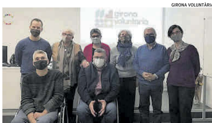
Alguns dels representants de les entitats constituents de Girona Voluntària.

■ La coordinadora té per objectiu promoure un nou tipus de voluntariat, que s'obri a nous perfils de col·laboradors, i amplii les activitats més enllà de l'acció social. ▶7