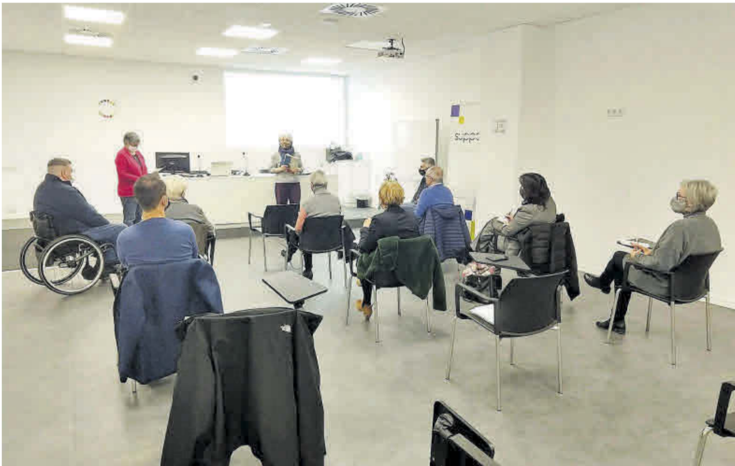
Alguns dels representants de les entitats durant la trobada constituent de Girona Voluntària.