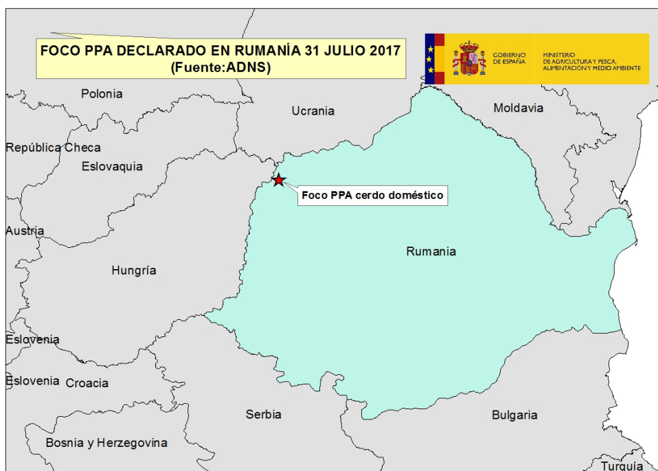
Mapa 1. Foco Rumanía 31 julio 2017

A continuación se incluye un mapa con la localización del foco declarado.