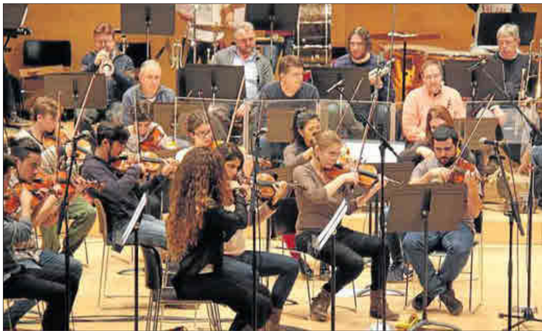
Un assaig de l'espectacle, ahir a la tarda a l'Auditori.