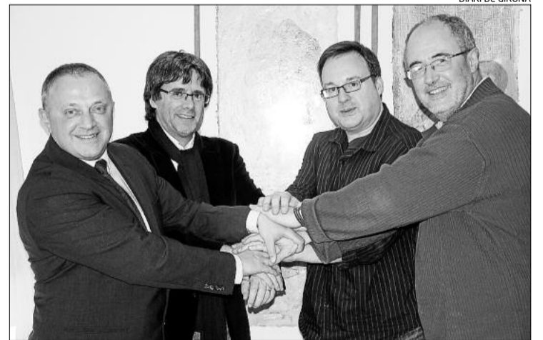
DIARI DE GIRONA

La JOCG és una iniciativa de l'Orquestra de Cadaqués que té